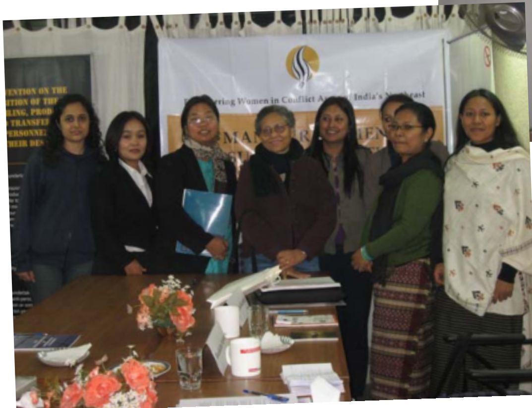
Some of the speakers at the event on 25 November 2008.

Nepram explicou que nesta região, em virtude de décadas de conflito armado e de deslocação forçada, muitas das crianças são orfãs e, por isso, mais vulneráveis ao tráfico de seres humanos. Sublinhou ainda que muitas das rotas de tráfico de mulheres são igualmente usadas para o tráfico de armas e drogas.