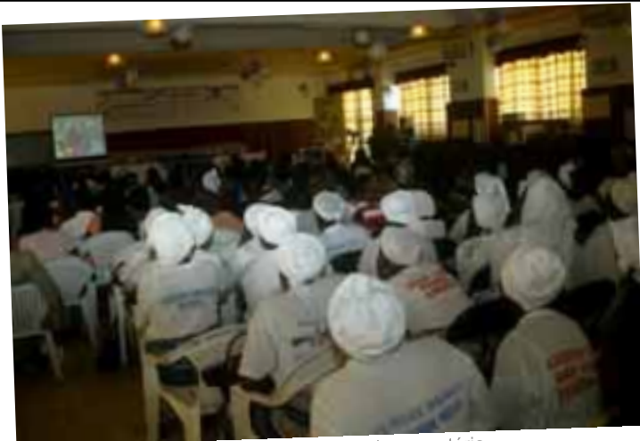
Algumas mulheres (WIPNET) visionam o documentário.

O conflito armado no Sri Lanka que opôs o governo aos Tigres de Tamil Eelam (LTTE) teve início em Julho de 1983. Até ao presente, o conflito resultou em 70,000 mortos. Em 21 milhões de habitantes, mais de 500, 000 permanecem deslocados internos e, de acordo com estatísticas do ACNUR de Junho de 2008, existem cerca de 134,948 refugiados.